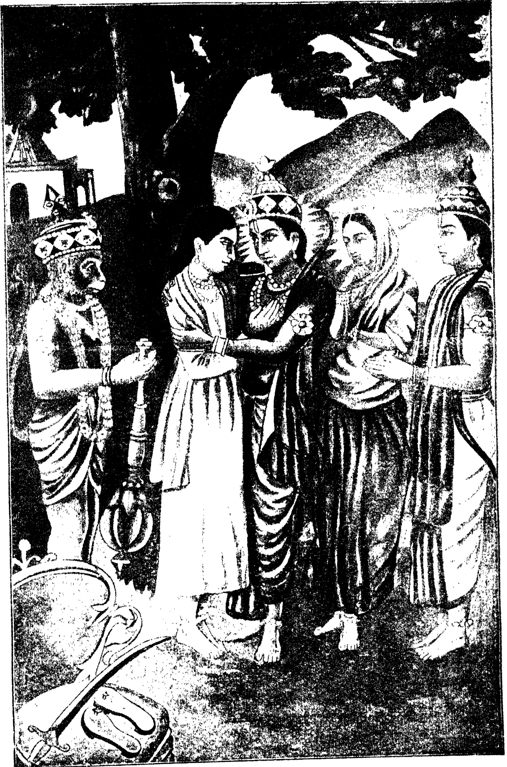
प्रभु मिलन कनुत्रहि मोह मोपहै जान नहि उरमा कटी ।